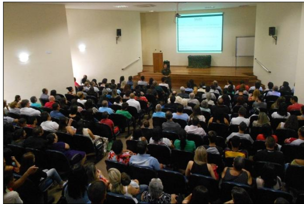
Palestra para os Familiares dos Recrutas

No dia 01 de março, foi realizada a cerimônia de incorporação dos novos recrutas da 1ª DL, com as seguintes atividades: palestra para os familiares dos recrutas, proferida pelo Chefe da 1ª DL e pelo 1º Ten Monteiro (Cmt CCAp); entrada dos recrutas pelo portão da OM, aberto pelo Chefe da 1ª DL e pelo recruta mais novo; formatura de incorporação; e lanche de confraternização dos familiares.