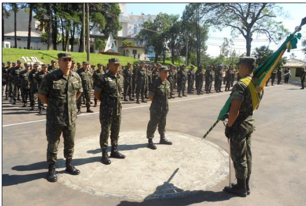
Entrega de Medalhas