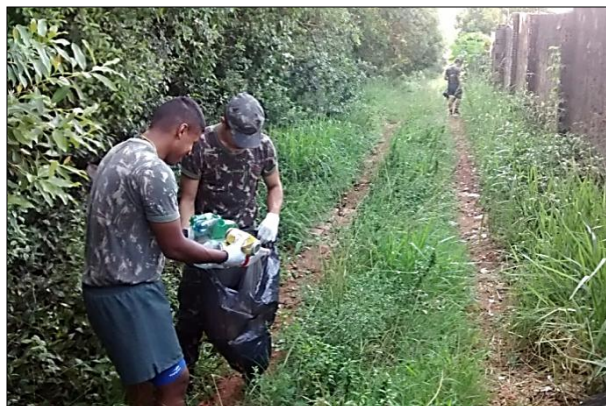
Limpeza de Áreas com Lixo Doméstico