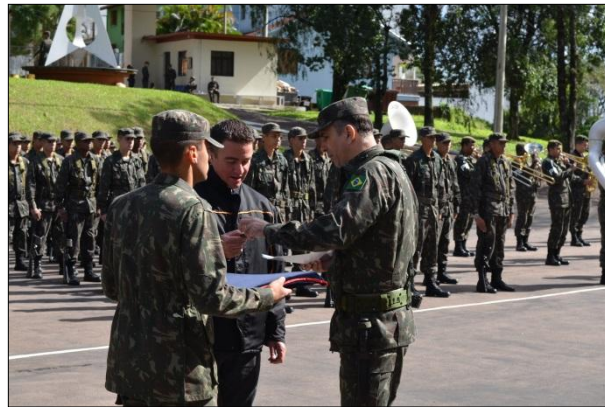
Entrega do Diploma ao Amigo da Comissão da Carta Geral