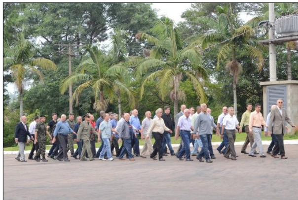
Desfile dos Ex-Integrantes da 1ª DL