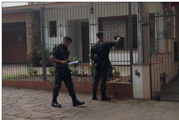
Distribuição de Panfletos

No dia 13 de fevereiro, 45 militares da 1ª DL participaram, em Porto Alegre-RS, da campanha nacional de conscientização no combate ao Aedes Aegypti, para esclarecer sobre a importância de se eliminar os focos de criação do mosquito transmissor da dengue, da chikungunya e do zika vírus.