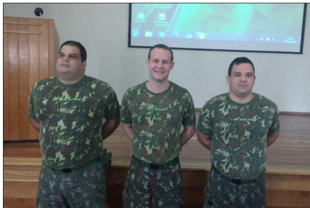
Diplomação dos Oficiais do QEM Concludentes do CAM