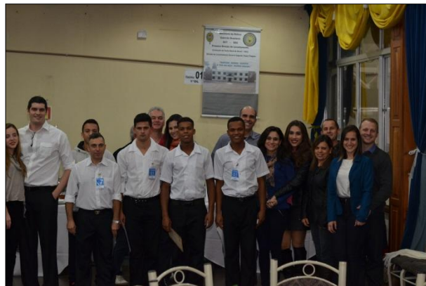
Carteanos e familiares no 7º Entrevero das Cozinhas Gaúchas