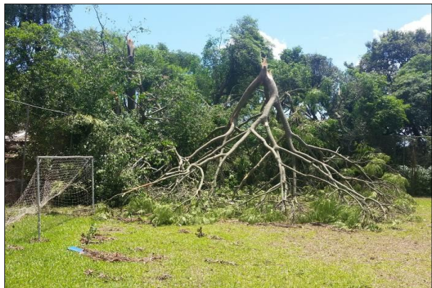
Árvores Derrubadas pelos Fortes Ventos

No dia 29 de janeiro, a 1ª DL sofreu estragos devido ao temporal que atingiu a cidade de Porto Alegre, onde foi realizado um mutirão na OM para limpeza e manutenção das instalações afetadas.