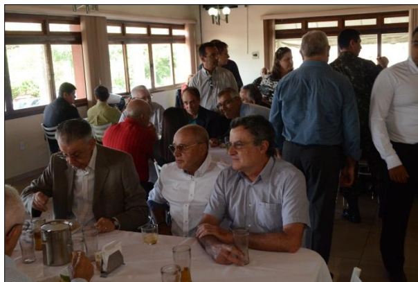
Almoço de Confraternização