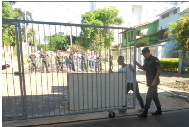
Abertura do Portão da OM