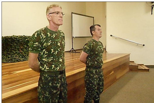
Apresentação dos Novos Integrantes da 1ª DL