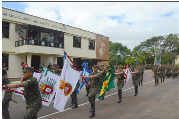
Desfile da Tropa