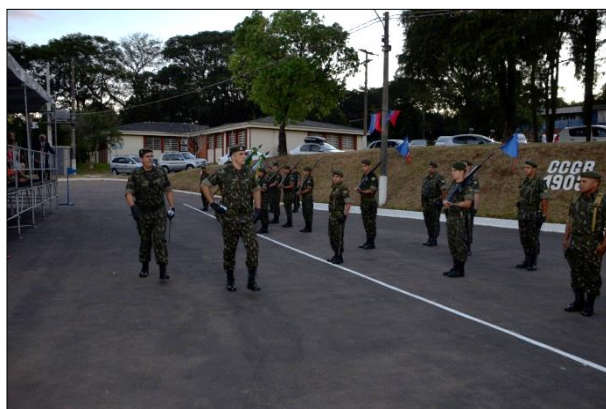
Revista à Tropa pelo Novo Chefe da 1ª DL