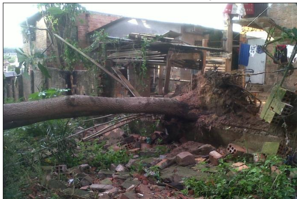
Muro Derrubado por Queda de Árvore