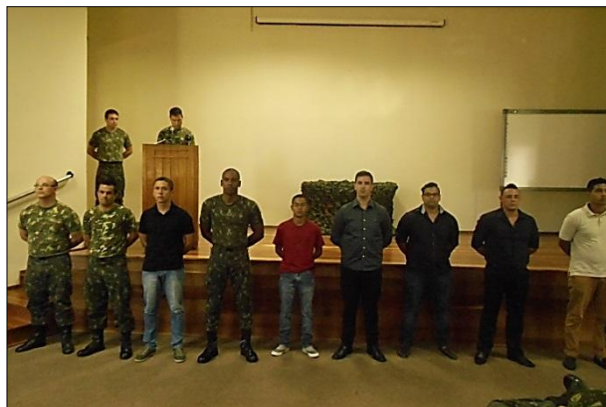
Despedida de Militares da 1ª DL