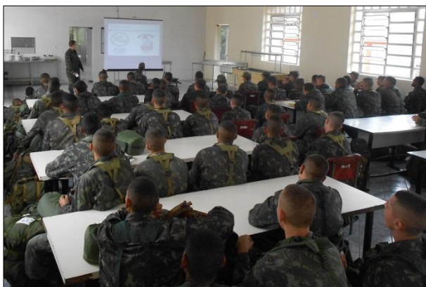
Palestra sobre a Gripe H1N1 para Cb/Sd da 1ª DL

No dia 29 de abril, foi realizada na 1ª DL uma palestra sobre Prevenção da Gripe H1N1, voltada para os Efetivos Profissional (Cb/Sd) e Variável (Sd), para posterior difusão entre seus familiares. Na oportunidade, o Médico da OM (Asp Port) apresentou os sintomas característicos, as medidas que devem ser tomadas nos casos de suspeita da doença e as atitudes simples de prevenção, por se tratar de doença infectocontagiosa que tem atingido principalmente a região sul do país no inverno.