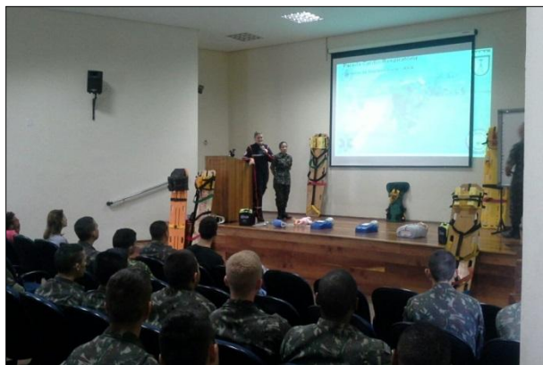
Parte Teórica do Curso no Auditório da 1ª DL

Foi realizado na 1ª Divisão de Levantamento nos dias 3, 4, 5, 10, 11 e 12 de fevereiro, o Curso Básico de Atendimento Pré-Hospitalar (APH), para capacitar profissionais da área de saúde no atendimento às vítimas de traumas (acidentes de trânsito, acidentes industriais, mal súbito, emergências cardiológicas e neurológicas e distúrbios psiquiátricos), visando sua estabilização clínica para posterior remoção para uma unidade hospitalar adequada. Participaram do curso servidores civis do SAMU de Sapucaia do Sul e da Secretaria Municipal de Saúde de Porto Alegre, integrantes do Corpo de Bombeiros e militares das seguintes OM do Comando Militar do Sul: 1ª DL; 3º Batalhão de Polícia do Exército; Centro de Preparação de Oficiais da Reserva de Porto Alegre; Hospital Militar de Área de Porto Alegre; 3º Batalhão de Comunicações; 16º Grupo de Artilharia de Campanha; 18º Batalhão de Infantaria Motorizada; 19º Batalhão de Infantaria Motorizada; 3º Regimento de Cavalaria de Guarda; e o 8º Esquadrão de Cavalaria Mecanizada.