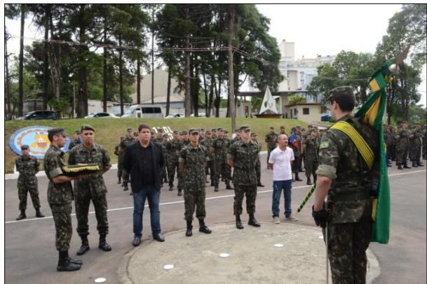
Entrega da Medalha Mérito Carteano