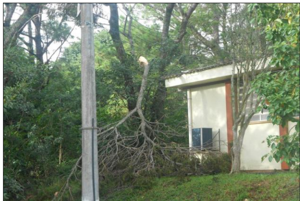
Telhado da SDT Danificado por Queda de Árvore