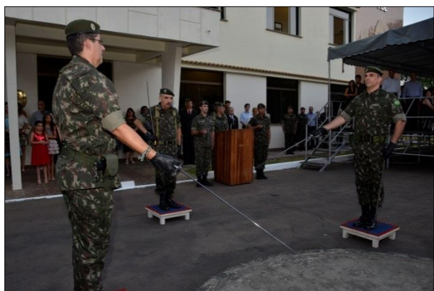
Transmissão do Cargo de Chefe da 1ª DL