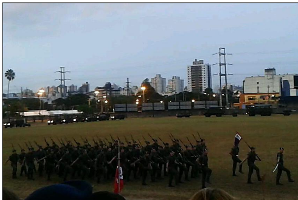
Desfile da Tropa da 1ª DL na Passagem de Cmdo do CMS