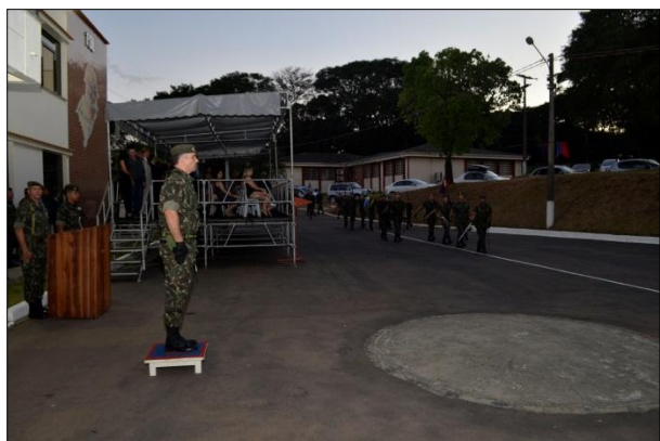
Desfile da Tropa para o Novo Chefe da 1ª DL