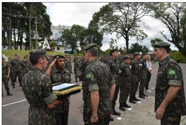
Entrega do Diploma aos Amigos da Comissão da Carta Geral