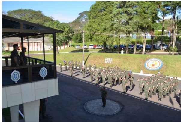
Formatura para o Diretor do Serviço Geográfico