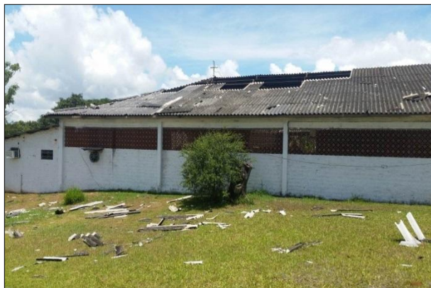
Destelhamento da Garagem