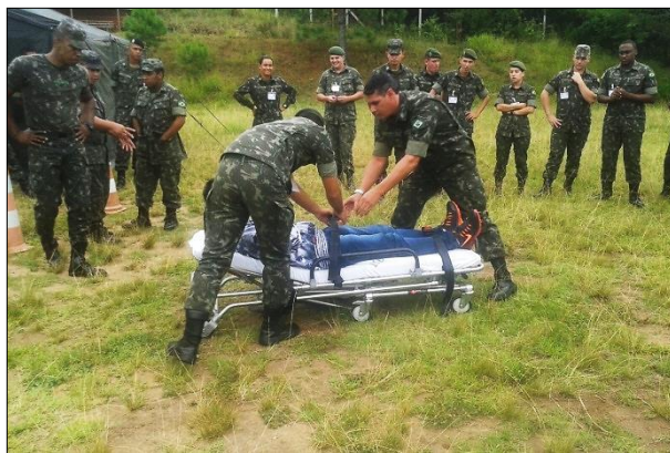
Parte Prática do Curso com a Simulação de Atendimentos