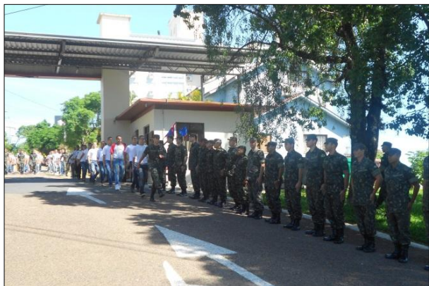
Entrada dos Novos Recrutas pelo Portão da 1ª DL