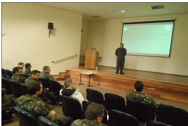
Simpósio de Administração da 1ª DL

No dia 29 de abril, foi realizado na 1ª DL o Simpósio de Administração da OM. O evento contou com a participação do Chefe, do Fiscal Administrativo e dos demais Agentes da Administração da 1ª DL, e na oportunidade foram realizadas palestras com a finalidade de promover o nivelamento, sedimentação e o aprimoramento dos conhecimentos já consagrados, bem como incentivar o debate e a apresentação de ideias para melhoria dos processos administrativos da OM.