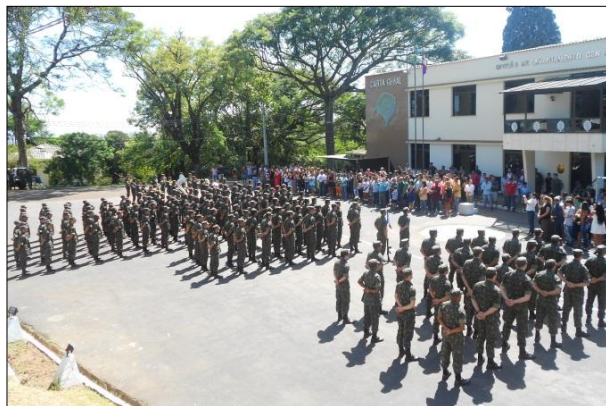
Formatura de Incorporação