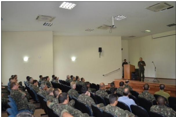
Reunião com Oficiais, Subtenentes e Sargentos