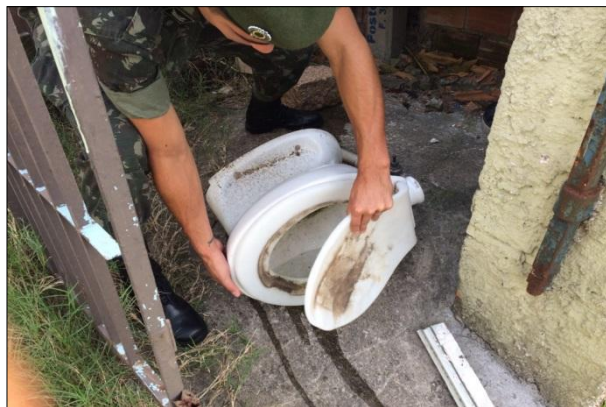
Eliminação de Focos de Criação do Mosquito