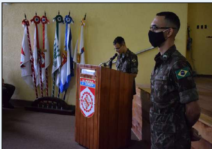
Palavras do Cap Da Penha.