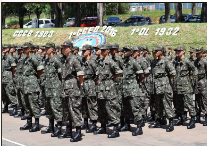
Grupamento de recrutas em forma.