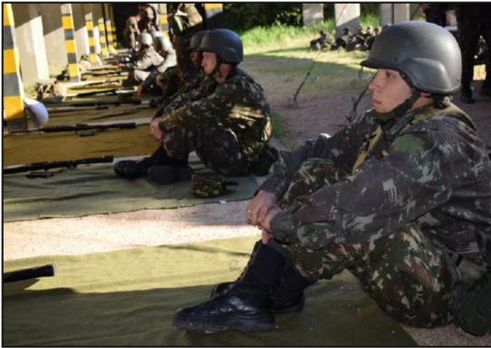
Preparação para o tiro.

7 DE ABRIL: Foi realizado o exercício de Tiro Individual Básico (TIB), com o fuzil 7,62 mm FAL (Fuzil Automático Leve) para os recrutas incorporados em 2020. A atividade castrense, prevista no Programa de Instrução Militar (PIM), teve por finalidade treinar as técnicas de execução de tiro real diurno e noturno aos recrutas. Tal atividade ocorreu no estande de tiro localizado na área de instrução do 3º Batalhão de Comunicações (3º BCOM). O resultado geral obtido foi considerado excelente.