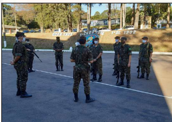
Atividades rotineiras com proteção.