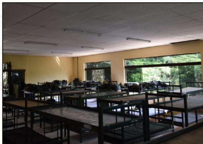
Cassino dos S Ten/Sgt disponibilizado.

1º DE ABRIL: O 1º CGEO recebeu o contingente aproximado de 100 (cem) militares do 9º Regimento de Cavalaria Blindado (9ºRCB), da cidade de São Gabriel – RS, em apoio à Operação COVID-19 do Comando Militar do SUI (CMS). Os referidos militares vieram do interior do Estado do Rio Grande do Sul com o propósito de serem empregados na região da Grande Porto Alegre. Para acomodar o efetivo do 9ºRCB, foram disponibilizadas as seguintes áreas: alojamento dos Cb/Sd, alojamento e cassino dos S Ten/Sgt e cassino dos oficiais.