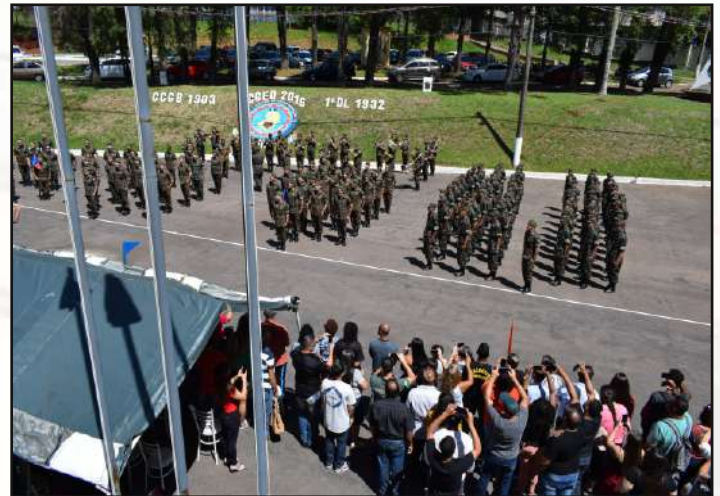
Formatura de incorporação