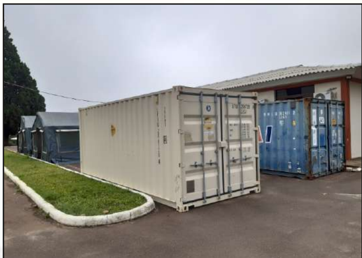
Infraestrutura de apoio.