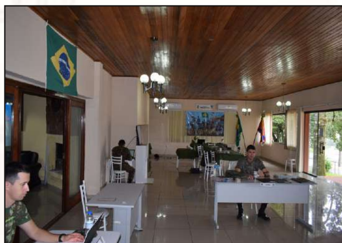
Cassino dos Oficiais disponibilizado.