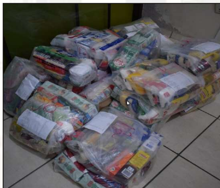
Parte das doações arrecadadas.

24 DE ABRIL: Os integrantes do 1º Centro de Geoinformação, sob a organização da Seção de Comunicação Social e Companhia de Comando e Apoio, participaram da 1ª Campanha de Arrecadação de Genéros Alimentícios. Ao todo, foram arrecadados mais de 300kg de alimentos não perecíveis em duas etapas. Desse modo, foi possível atender às famílias do Efetivo Variável mais necessitadas em função das restrições de trabalho impostas pela emergência de saúde pública em curso.