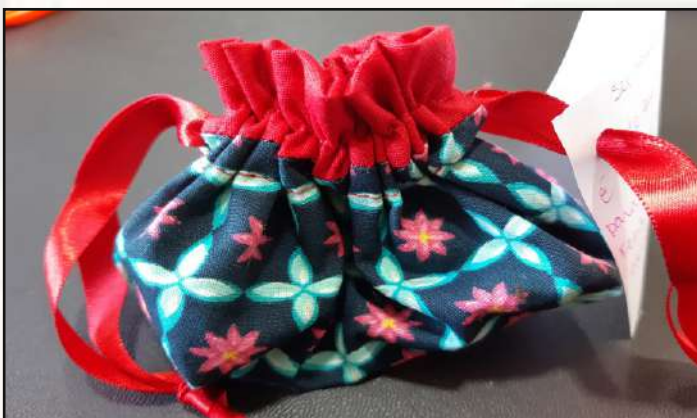
Lembrança do Dia Internacional da Mulher