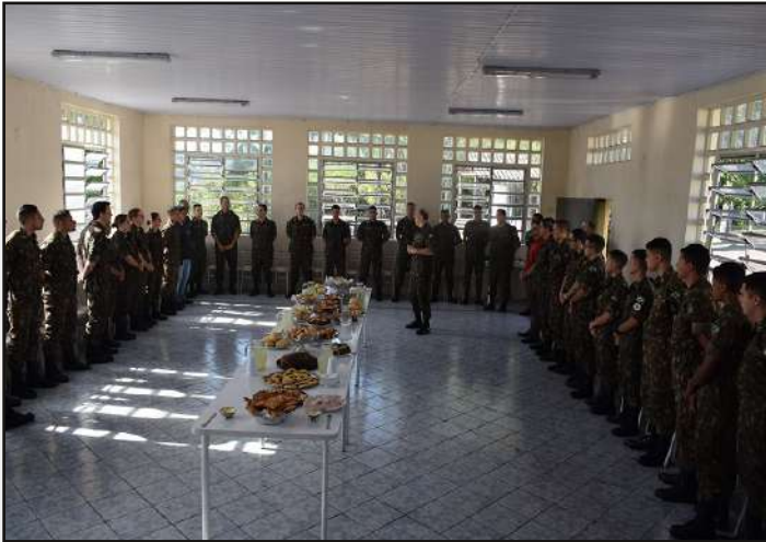
Café da manhã festivo com o Efetivo Profissional.