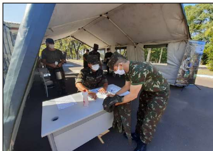
Verificação dos dados dos militares.

23 DE ABRIL: Foi realizada a vacinação dos integrantes do 1º CGEO (militares do Efetivo Profissional e Variável) pelos profissionais da Seção de Saúde. A Campanha de Vacinação Contra a Gripe teve o propósito de preservar a saúde de militares do Centro e manter o nível de prontidão da tropa. A proteção da Vacina contra a Gripe começa de 2 a 3 semanas após sua administração e dura, por no máximo, 1 (um) ano. Por isso a necessidade de que a referida campanha seja realizada anualmente.