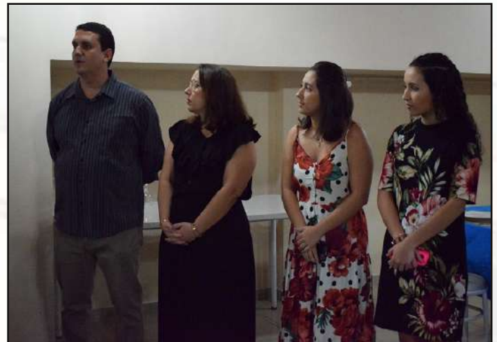
Novo Chefe nomeado e familiares.