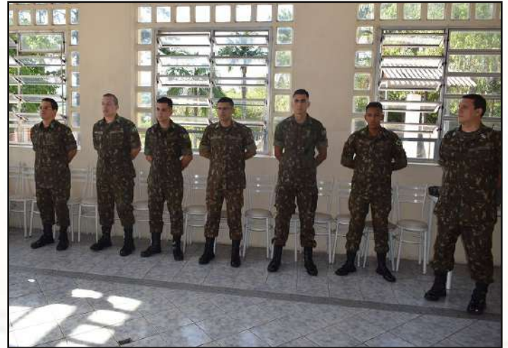
Aniversariantes do mês de dezembro de 2019.