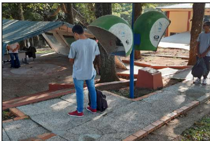
Triagem com a Equipe de Saúde.

ABRIL: No contexto do combate e prevenção à Pandemia de COVID-19, foram adotadas as seguintes medidas de proteção à saúde dos integrantes do Centro: instalação de um posto de triagem clínica-epidemiológica para acesso à OM; distribuição de máscaras de proteção caseiras; distribuição e disponibilização de álcool em gel em pontos estratégicos no interior da OM; respeito ao distanciamento social, evitando aglomerações; promoção do acesso aos refeitórios de forma escalonada; suspensão das atividades centralizadas de Treinamento Físico Militar (TFM), desinfecção de instalações, entre outras.