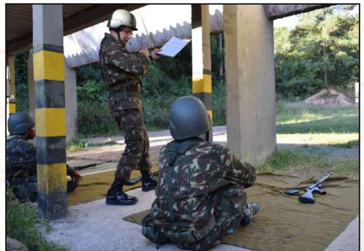
Orientação do recruta pelo monitor.