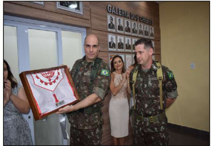
Recebimento da isígnia do 1º CGEO.