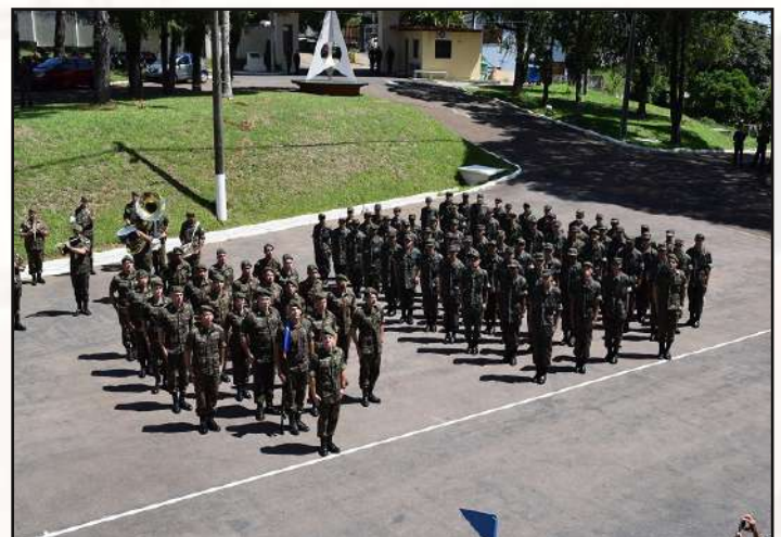
Grupamento de recrutas em forma.