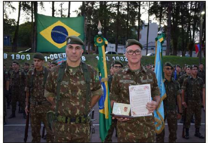
Entrega de elogio e lembrança.