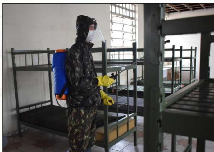
Desinfecção das instalações pelo 3º RCG.