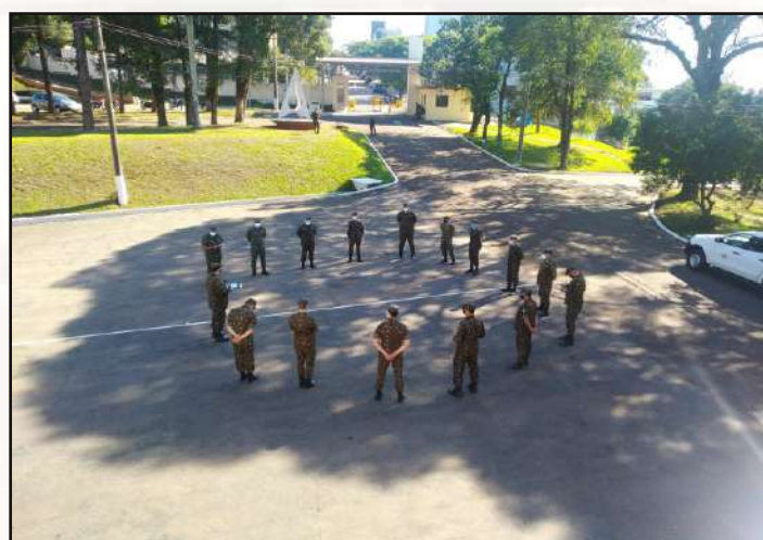
Reuniões com distanciamento.