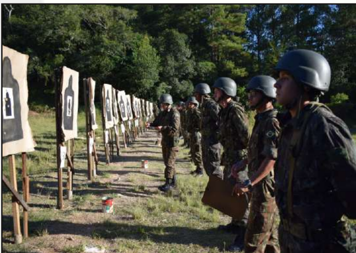
Verificação dos impactos.