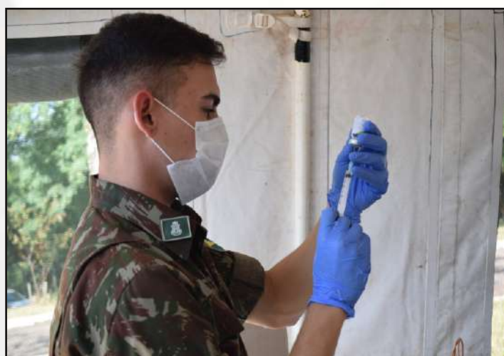
Preparação para a aplicação da vacina.