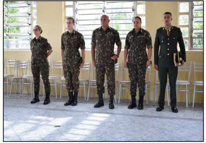
Apresentação de militares recém chegados.