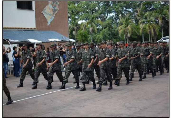
Grupamento de recrutas em desfile.