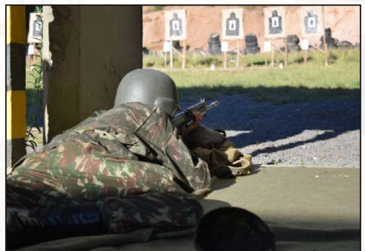
Execução do tiro deitado, com apoio.