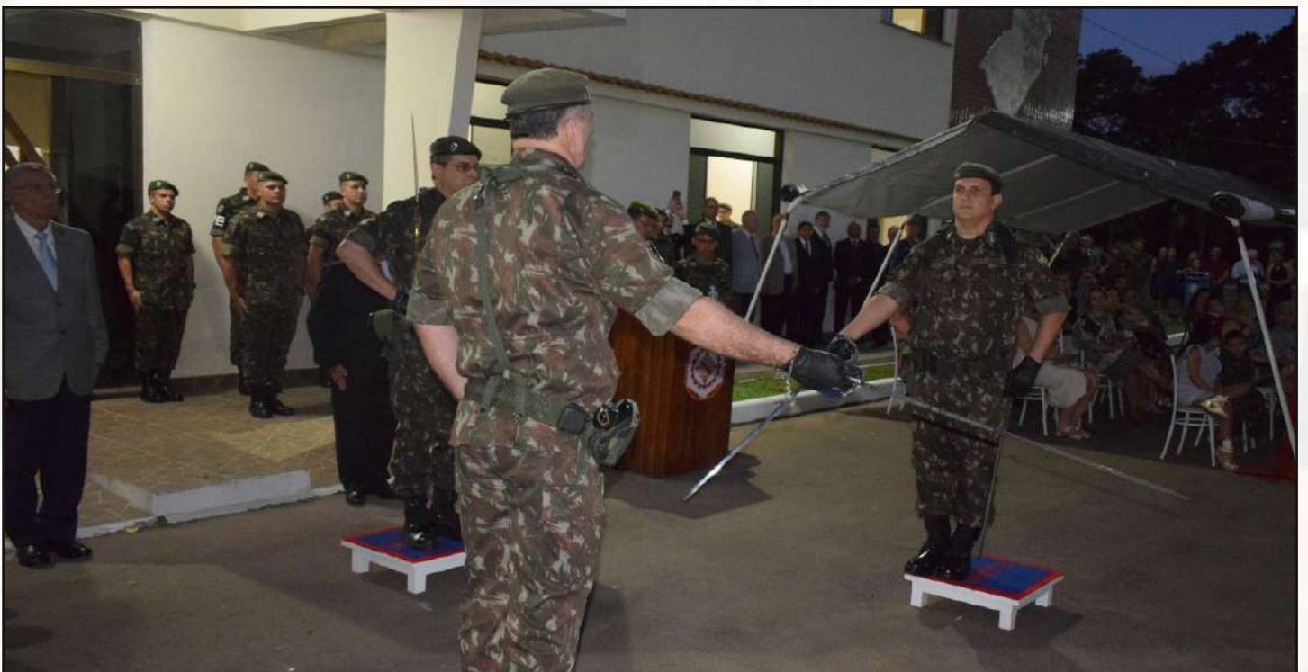
Cerimônia de transmissão do cargo de Chefe do 1º CGEO.