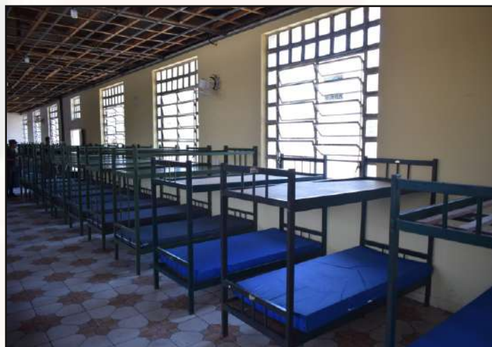
Alojamento dos Cb/Sd disponibilizado.