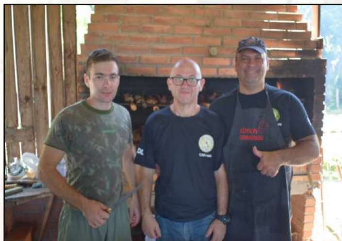
Equipe de churrasco.