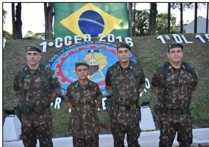
Chefes e autoridades militares da ativa.