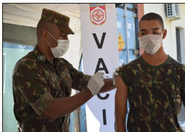
Aplicação da vacina.