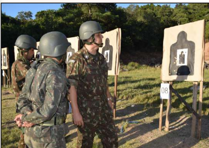
Chefe do 1º CGEO acompanhando a instrução.