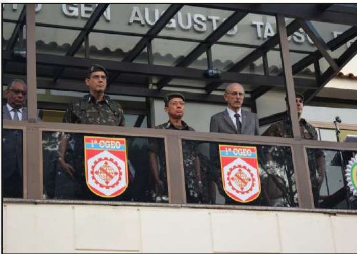
Palanque das autoridades.