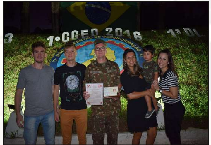
Foto de despedida.