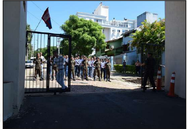
Grupamento do Efetivo Variável 2020.