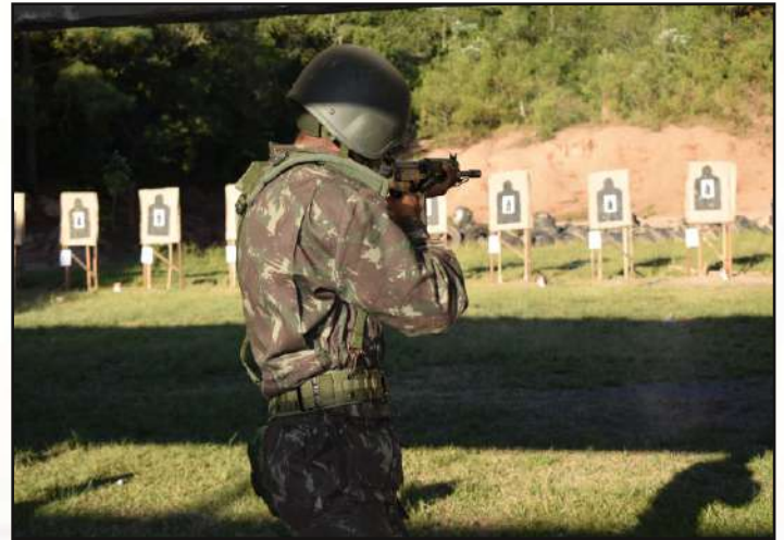
Execução do tiro na posição "de pé".