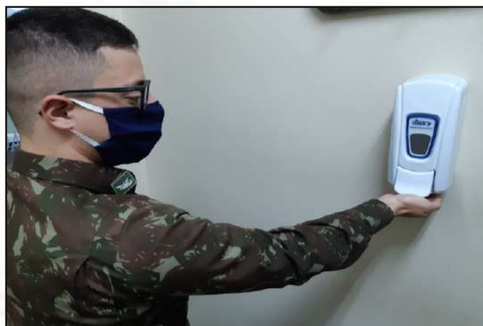
Disponibilização de álcool em gel.