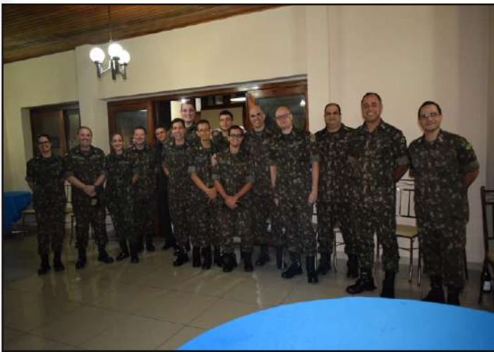
Integrantes do 1º CGEO.