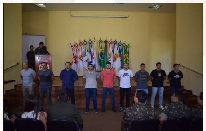
Despedida de Cabos e Soldados da OM.