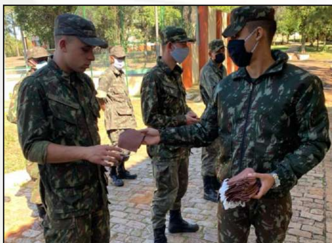
Distribuição de máscaras de proteção.