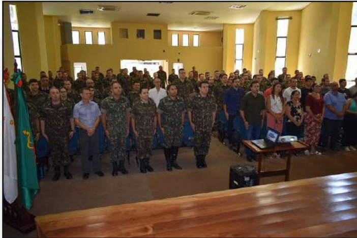
Cerimônia no auditório.