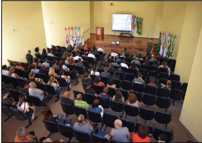
Palestra com o Ten Cel Azeredo.

2 DE MARÇO: Foi realizada no 1º CGEO a formatura de incorporação do Efetivo Variável. Na referida oportunidade, foi realizada pelo Ten Cel Azeredo e 1º Ten Pithan, Chefe do 1º CGEO e Comandante da Companhia de Comando e Apoio, respectivamente, uma palestra aos familiares dos recrutas.. Desse modo, foi possível ambientar as famílias acerca das peculiaridades da vida militar e as principais atividades do ano de instrução. Posteriormente, ocorreu a cerimônia de entrada dos novos soldados pelo portão da OM, aberto pelo Ten Cel Azeredo e pelo recruta XXXXXXXX, mais novo da turma. No prosseguimento das atividades, foi realizada uma formatura e um lanche.