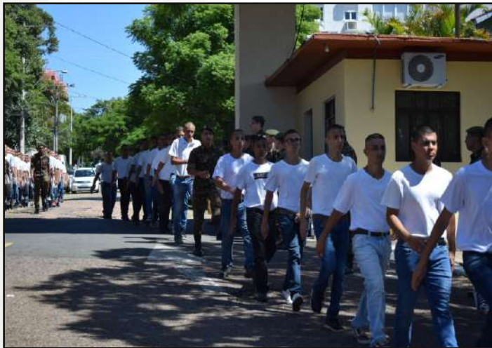
Entrada dos recrutas pelo portão do 1º CGEO.