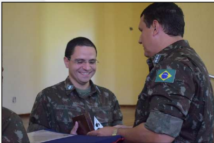
Despedida do Maj Da Penha.