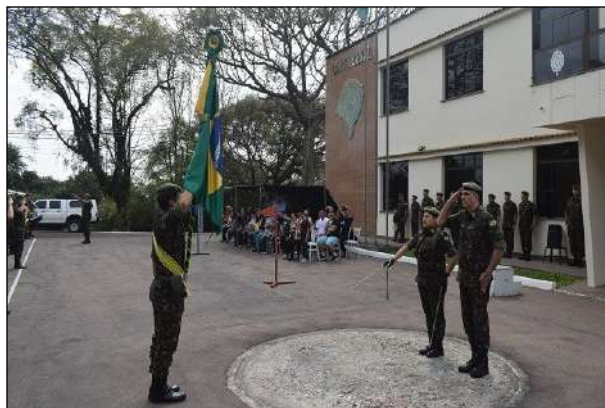
Juramento ao 1º Posto de Oficial