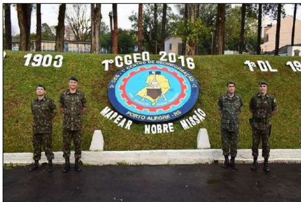
Chefe do 1º CGEO e Integrantes da Comitiva da DSG