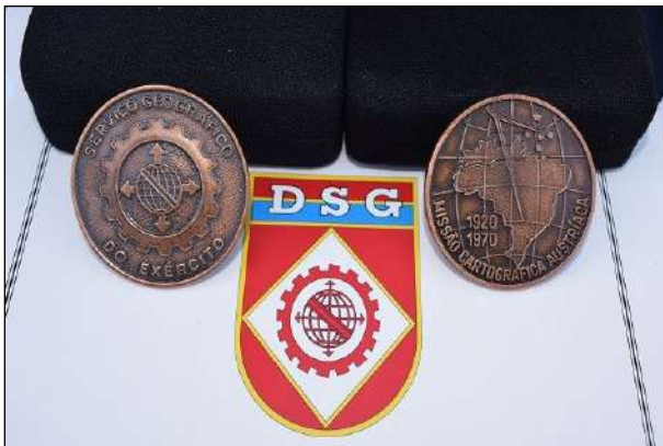
Prêmio Missão Cartográfica Austríaca