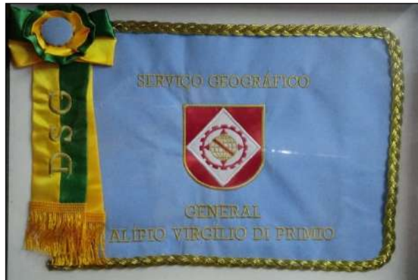
Estandarte Histórico da DSG