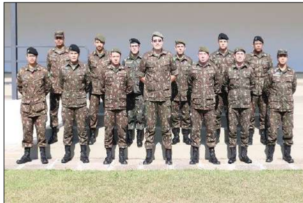
Participantes do Estágio