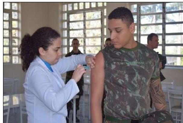
Vacinação de Militar do 1º CGEO

No dia 26 de junho, o 1º CGEO participou da campanha de vacinação contra a gripe H1N1, onde foram vacinados 150 militares e civis do 1º CGEO e 3º BPE e respectivos familiares.