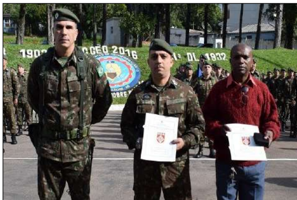
Agraciados com o Prêmio Missão Cartográfica Austríaca