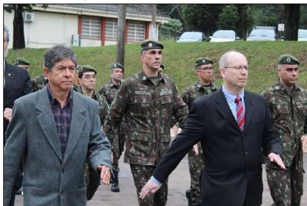
Desfile dos Militares da Reserva e da Ativa do QEM