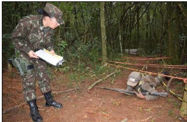
Instrução na Área Verde do 1º CGEO

No período de 6 a 10 de maio, foi realizado o acampamento dos Soldados do Efetivo Variável (Sd EV) incorporados no ano de 2019, dentro da área verde de instrução do 1º CGEO e do 3º BCom, onde foram realizadas várias atividades previstas no Período de Instrução e de Adestramento Básico.