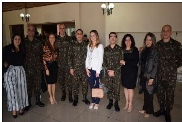
Almoço Comemorativo ao Dia do QEM