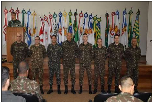
Promoção de Militares