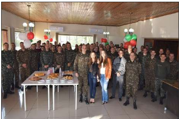
Café da Manhã Festivo com a Participação de Of/ST/Sgt