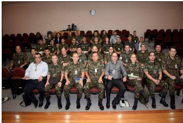
Participantes do Simpósio