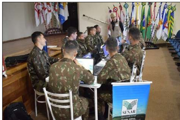
Apresentação dos Conceitos Teóricos do Curso

No período de 1 a 4 de julho, foi realizado o Curso de Informática Básica, ministrado pelo SENAR, que contou com a participação de 12 militares da OM e teve a duração de 32 horas.