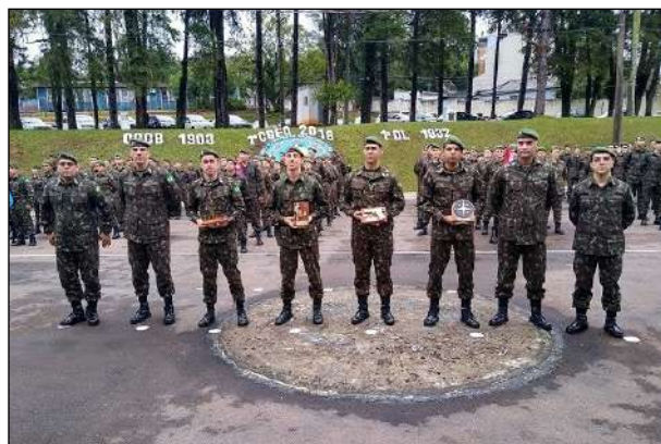
Premiação das Competições Esportivas