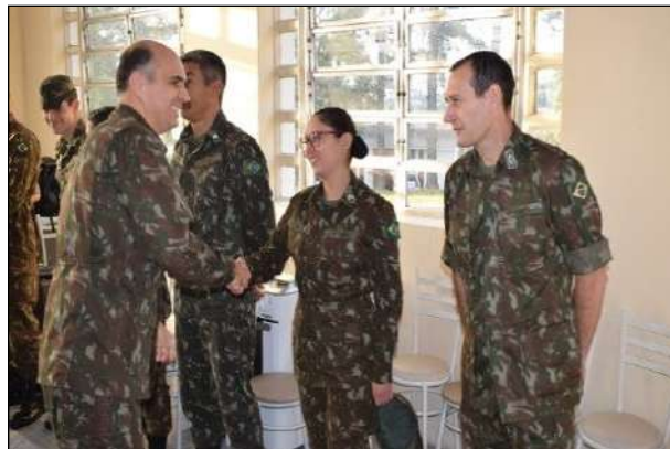
Cumprimento do Chefe do 1º CGEO aos Aniversariantes