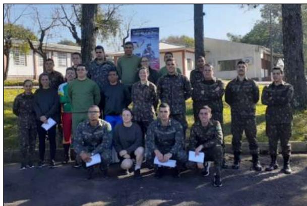
Participantes da Prova de Orientação no 1º CGEO