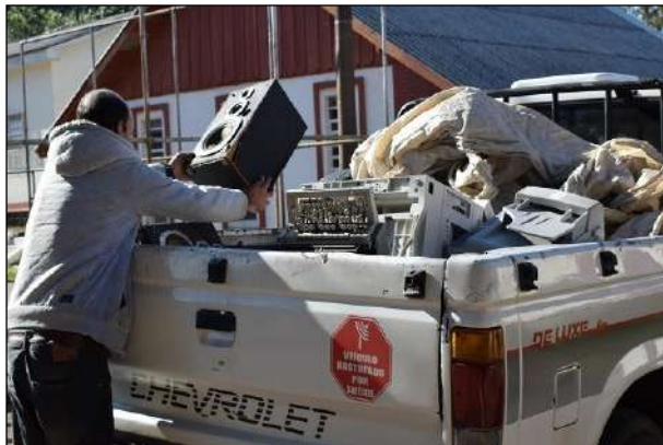
Coleta dos Resíduos Eletrônicos

No dia 27 de junho, o 1º CGEO realizou, por intermédio da empresa Coopertec – Soluções em Reciclagem Tecnológica, o descarte de resíduos de equipamentos eletrônicos (REEE), que, de acordo com o previsto na legislação ambiental, devem ser tratados antes de serem descartados.