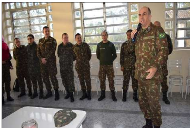
Palavras do Chefe do 1º CGEO

No dia 27 de junho, o 1º CGEO realizou um café da manhã em homenagem aos militares dos Efetivos Variável e Profissional que aniversariam no mês de junho do corrente ano.