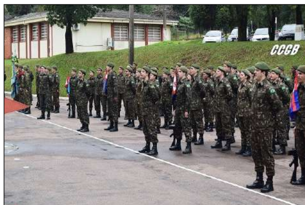
Tropas do 1º CGEO, 1º CTA, CRO/3 e AGGC