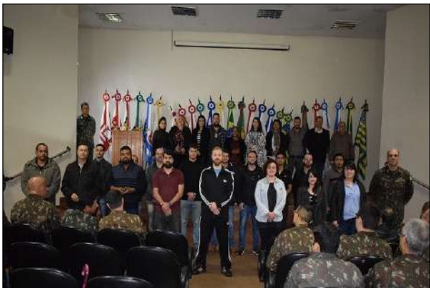
Despedida dos Servidores Civis Temporários