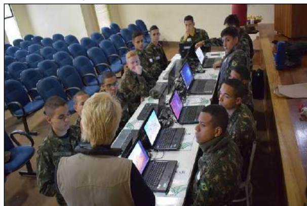
Apresentação dos Conceitos Práticos do Curso