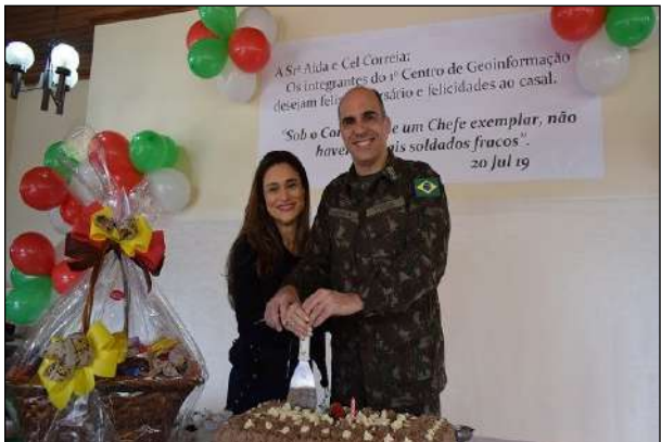
Chefe do 1º CGEO e Esposa