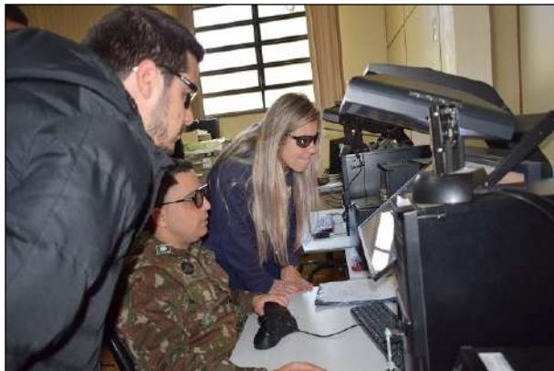
Visita à Divisão de Geoinformação