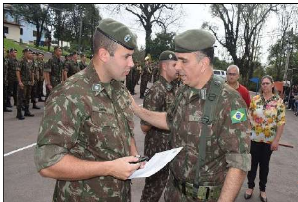
Entrega de Certificados