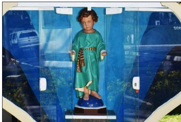
Imagem do Menino Deus após a Restauração