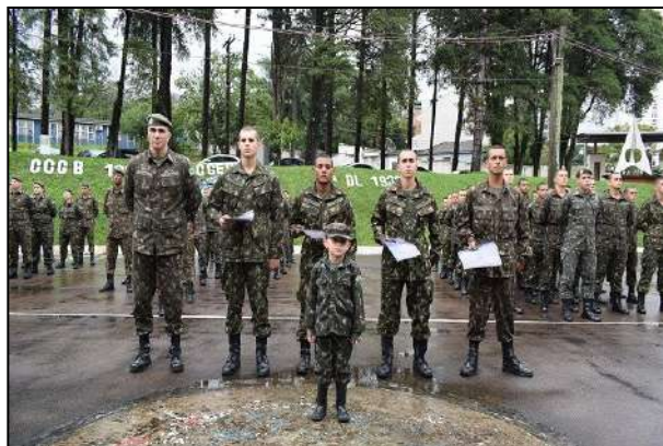
Diplomação dos Destques do Período Básico