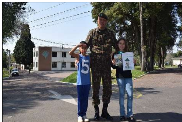
Visita de Alunos de Escola Estadual ao 1º CGEO

No dia 26 de agosto, o Ch do 1º CGEO recebeu a visita de 2 alunos do 5º ano da EEEF Cel Tito Marques Fernandes, localizada na área da OM, que entregaram um cartão pelo Dia do Soldado.