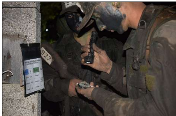
Instrução Noturna no 1º CGEO