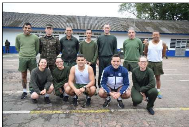
Equipe de Corrida do 1º CGEO