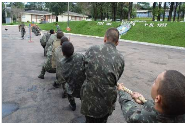
Competição de Cabo de Guerra

No período de 20 a 22 de maio, o 1º CGEO realizou as Olimpíadas Internas para os Soldados do Efetivo Variável incorporados no ano de 2019. Na oportunidade, foram realizadas as competições de Futebol de Campo, Cabo de Guerra, Corrida com Fuzil e Flexão, cujos objetivos foram promover a integração e desenvolver o espírito de equipe entre os recrutas que recém ingressaram na caserna.