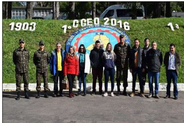
Participantes da Visita da UFSM