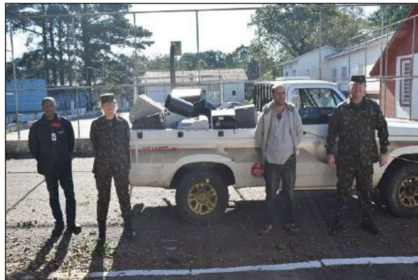
Equipe do 1º CGEO e da Empresa Coopertec