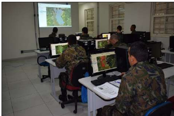
Realização do Estágio no 1º CGEO

No período de 1 a 5 de julho, o 1º CGEO realizou o Estágio Básico de Geoinformação para 8 militares do 1º Grupo de Defesa Antiaérea (GDAEA) da Força Aérea Brasileira.