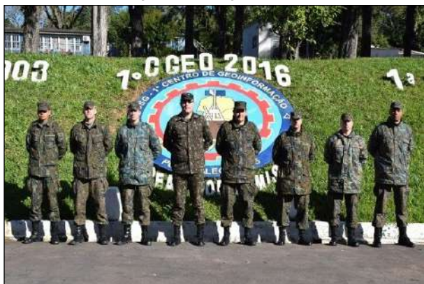
Participantes do Estágio