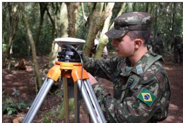
Instrução Prática de Levantamento GPS