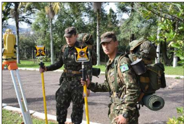
Instrução Prática de Levantamento Topográfico