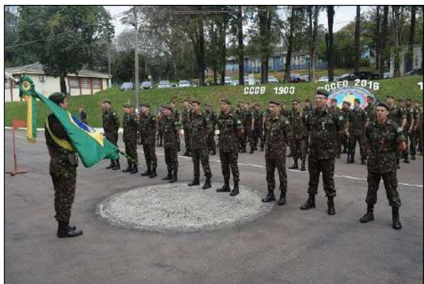
Condecoração de Militares