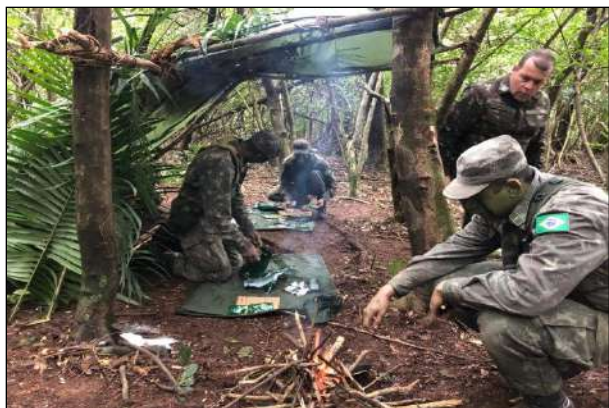
Acampamento do CFC na Área Verde do 1º CGEO

No período de 10 de Junho a 30 de agosto, foi realizado no 1º CGEO, o Curso de Formação de Cabos da QM 05-15 (Aux Topo), que contou com a participação de 12 Soldados do Efetivo Variável. No curso foram ministradas instruções teóricas e práticas de caráter militar e de fundamentos de topografia, com a finalidade de habilitar os militares para o desempenho das atividades da OM.