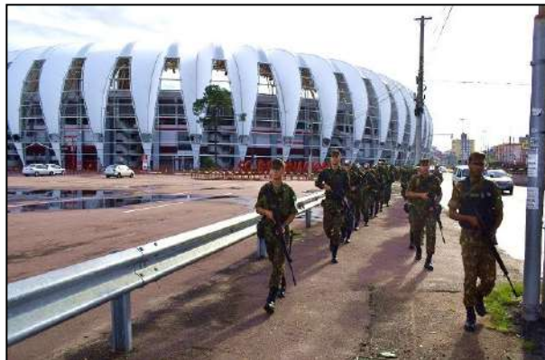
Marcha de 8 Km