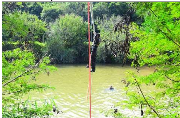
Transposição de Curso D'água no 3º BCom