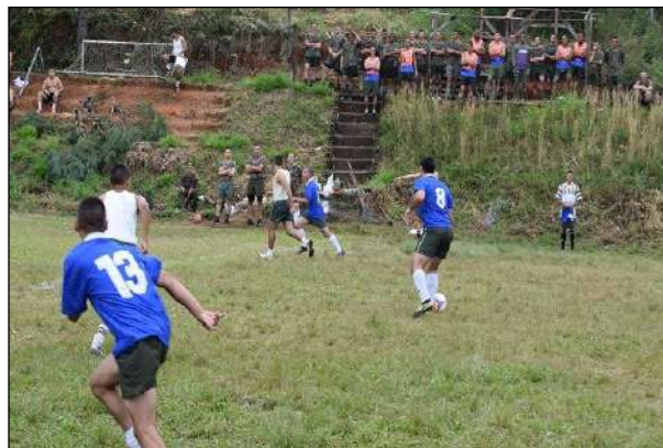
Competição de Futebol de Campo