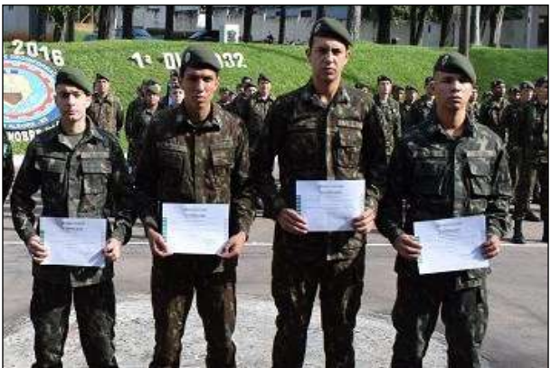
Entrega de Certificados de Conclusão de Curso