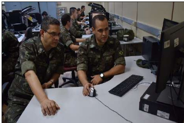
Visita do Gen Pedro Paulo à Divisão de Geoinformação