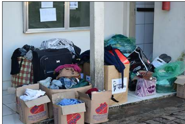
Roupas, Agasalhos, Calçados e Cobertores Arrecadados

No período de 7 de maio a 5 de junho, o 1º CGEO participou da campanha anual de doação de agasalhos, coordenada pelo CMS.