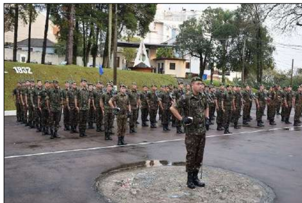
Formatura de Recepção ao Diretor do Serviço Geográfico