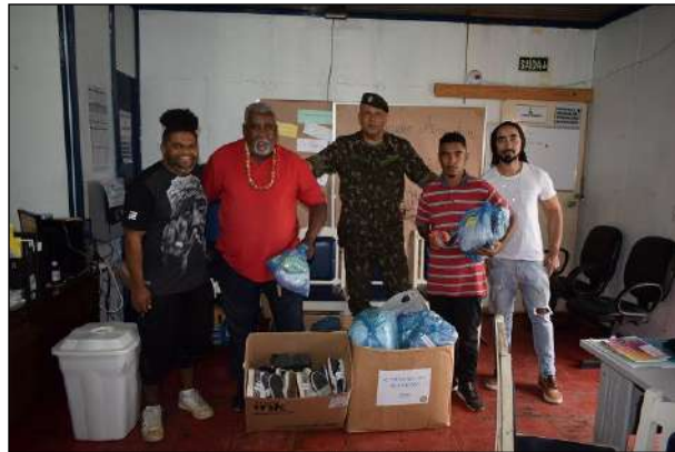
Entrega das Doações na Associação da Villa Tronco Neves