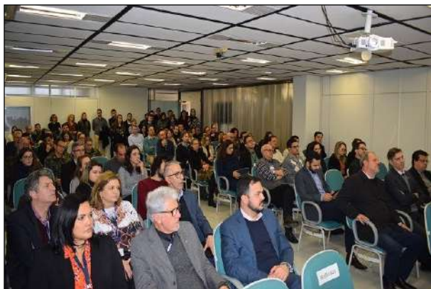
Evento de Lançamento da IEDE na SEPLAG-RS

No dia 15 de agosto, o 1º CGEO participou do evento de lançamento do Geoportal da IEDE-RS, que contou a presença do Governador e da Secretária de Planejamento do Estado do RS.