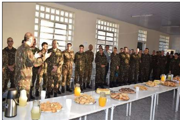
Palavras do Chefe do 1º CGEO

No dia 22 de julho, o 1º CGEO realizou um café da manhã em homenagem aos militares dos Efetivos Variável e Profissional que aniversariam no mês de julho do corrente ano.