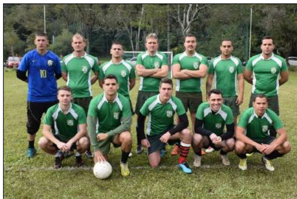
Equipe do 1º CGEO – Campeã do Torneio de Futebol