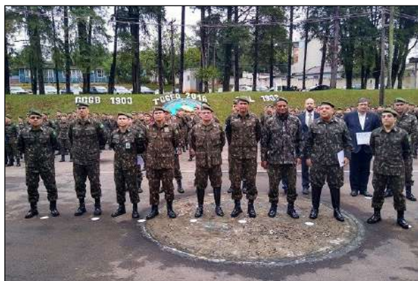
Entrega do Diploma de Amigo do QEM