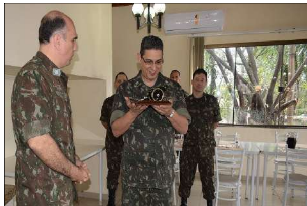
Entrega de Lembrança para o Gen Pedro Paulo