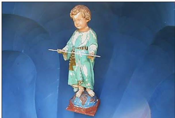
Imagem do Menino Deus antes da Restauração

No mês de agosto, foi concluído o trabalho de restauração da imagem do “Menino Deus”, padroeiro da OM desde 26 Mar 1982. Além disso, foi realizada a reforma da concha que abriga a imagem, com a recuperação de toda a pintura e a instalação de uma proteção de vidro contra as intempéries.