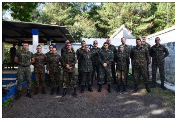
Participantes da Competição de Tiro no CPOR-PA