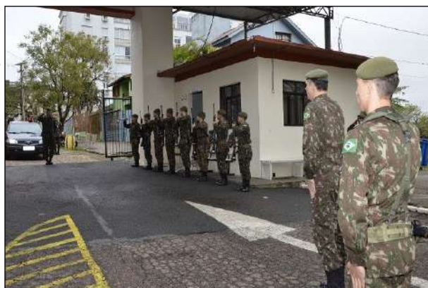
Recepção ao Sr. Diretor de Fabricação