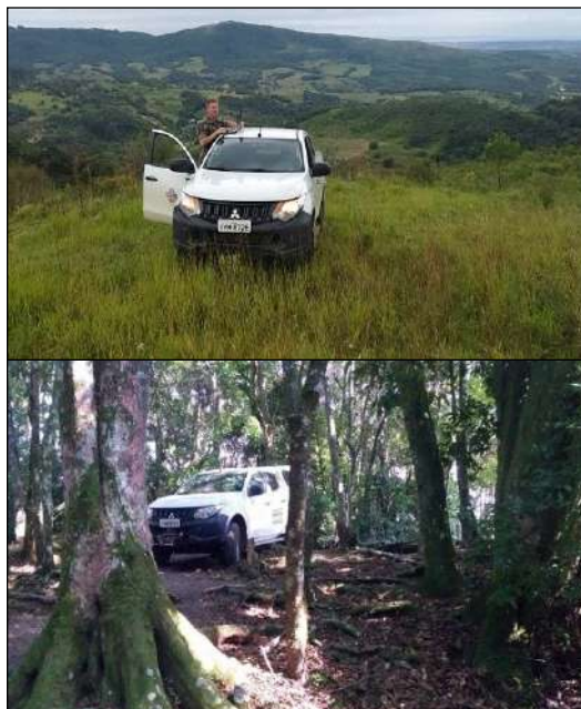
Coleta de Informações no Terreno