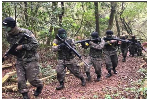
Instrução de Patrulha na Área Verde do 1º CGEO