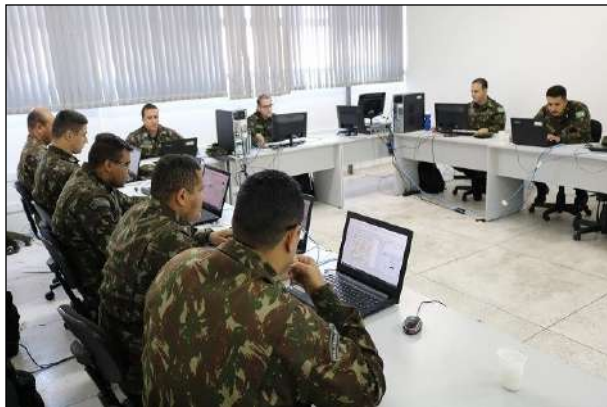
Realização do Estágio de Geoinformação no 11º CTA

No período de 5 a 16 de agosto, foi ministrado pelo 1º CGEO, nas instalações do 11º CT (Curitiba-PR), o 2º Estágio de Geoinformação para Corpo de Tropa de 2019 - Estágio de Área do CMS, que contou com a participação de 11 militares de Organizações Militares da Guarnição de Curitiba-PR.