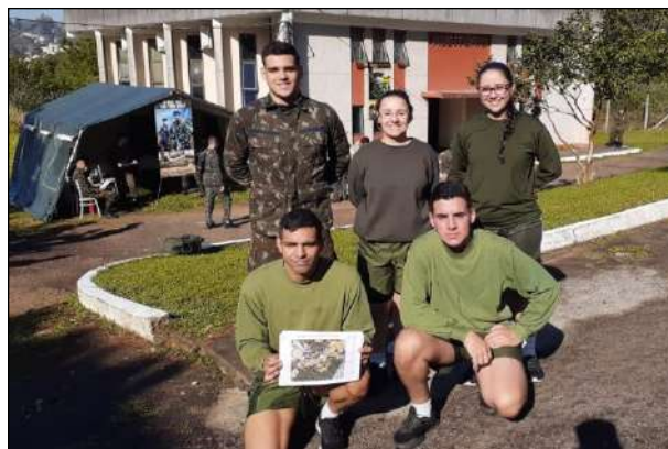
Equipe do 1º CGEO – Campeã da Prova de Orientação