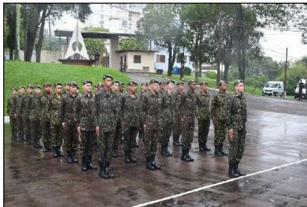
Grupamento dos Sd EV