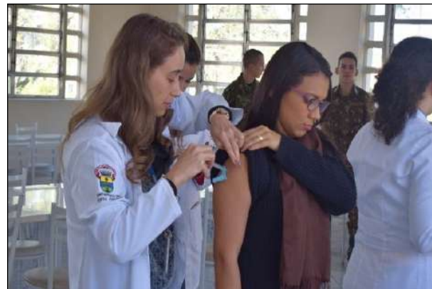
Vacinação dos Familiares