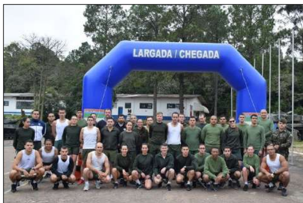
Participantes da Corrida no CPOR-PA