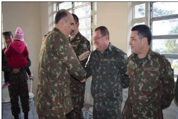
Cumprimento do Chefe do 1º CGEO aos Aniversariantes